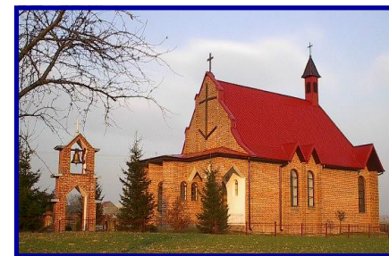
Kościół filialny w Ornatowicach