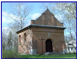
Kościół filialny w Skomorochach Dużych