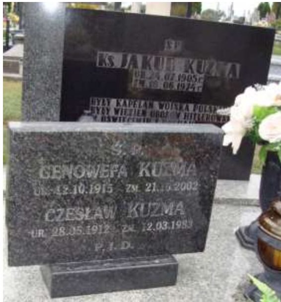
Nagrobek 32 – Rok 2012, 7 września. Nagrobek rodziny Kuźma.