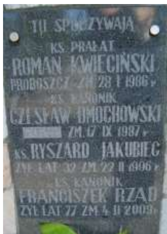
Zdjęcie 37 – Rok 2012, 30 września. Tablica informacyjna na cmentarzu w Janowie Lubelskim.