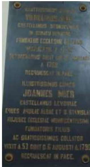
Zdjęcie 6 – Rok 2013, 9 czerwca. Epitafium Mierów w kościele Nawiedzenia Najświętszej Marii Panny w Wozuczynie.

Pochodzenie rodziny Mierów. Rodzina szwedzka, nobilitowana w Szwecji 16 października 1680 roku, otrzymała świadectwo szlachectwa w Szkocji 5 września 1725 roku, indygenat w Polsce (uznanie obcego szlachectwa) 28 października 1726 roku, mianowani hrabiami w Austrii 7 marca 1777 roku. Rodzina patrycjuszowska gdańska 914 .