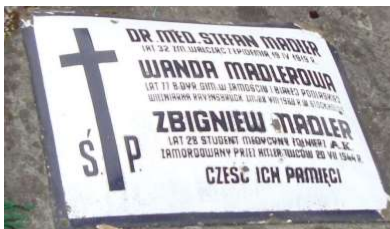
Nagrobek 2 – Rok 2012, 7 sierpnia. Nagrobek rodziny Madler.

Urodziła się 1891 roku (około). Dyrektor gimnazjum w Zamościu, Białej Podlaskiej 45 . Więzień obozu w Ravensbrück.