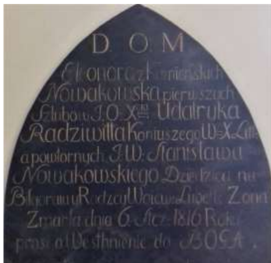
Zdjęcie 17 – Rok 2019, 11 maja. Tablica nagrobna Eleonory z Kamińskich Nowakowskiej, primo voto Radziwiłł.