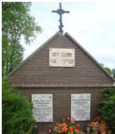
Zdjęcie 13 – Rok 2013, 14 maja. Grobowiec Namysłowskich na cmentarzu parafialnym w Starym Zamościu.

Urodził się 23 kwietnia 1879 roku. Syn Karola Franciszka 1486 .