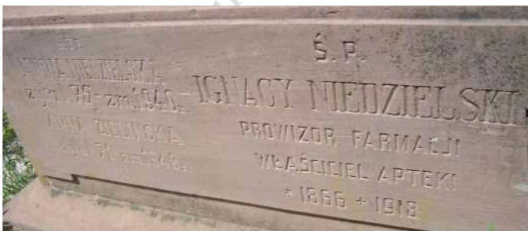
Nagrodek 35 – Rok 2014, 8 czerwca. Nagrobek Ignacego Niedzielskiego.

Prowizor farmacji. Właściciel apteki w Krasnobrodzie.