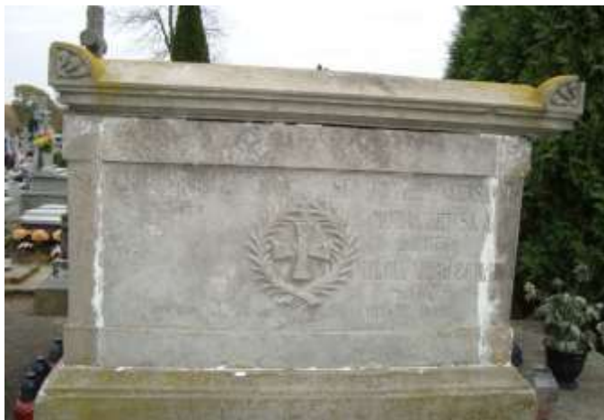
Nagrobek 24 – Rok 2012, 25 października. Nagrobek rodziny Węgleńskich, Moraczewskich.