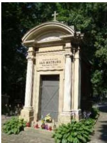
Nagrobek 13 – Rok 2017, 19 lipca. Nagrobek Jana Matejki i jego rodziny.

W rodzinnym grobowcu na Cmentarzu Rakowickim w Krakowie pochowani są także: