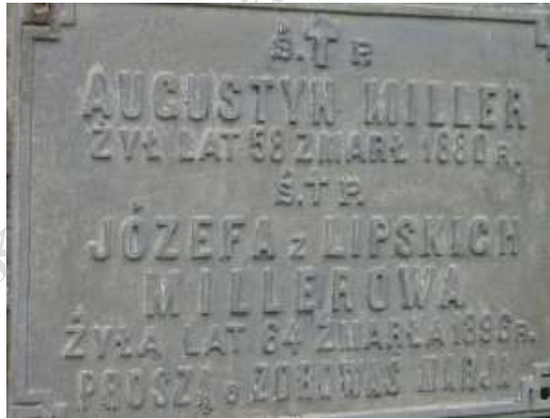
Nagrobek 30 – Rok 2012, 6 maja. Nagrobek Müllerów.