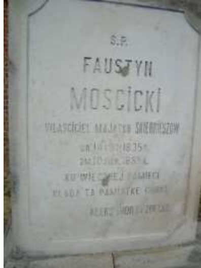
Nagrobek 28 – Rok 2012, 12 maja. Nagrobek Faustyna Mościckiego.

Zmarł 10 sierpnia 1885 roku. Pochowany, w rodzinnym grobowcu, na cmentarzu parafialnym w Skierbieszowie 1332 .