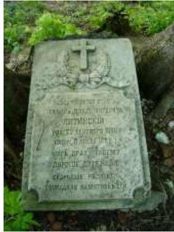
Nagrobek 8 – Rok 2019, 19 maja. Turowiec. Nagrobek Tychona Lityńskiego.