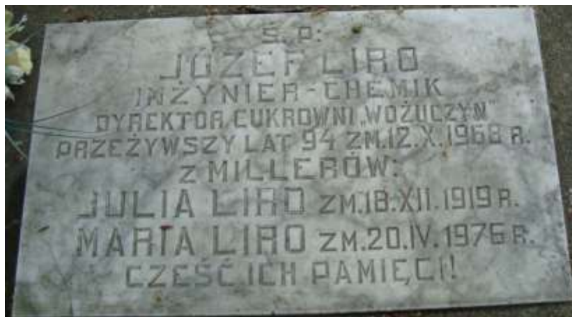
Nagrobek 7 – Rok 2013, 31 maja. Nagrobek rodziny Liro.

Zmarł 12 października 1968 roku. Pochowany w rodzinnym grobowcu na cmentarzu parafialnym w Woźuczynie 524 .