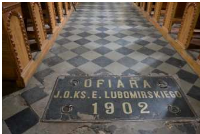
Zdjęcie 11 – Rok 2011, 16 czerwca. Napis na posadzce w kościele r.l. w Uchaniach.