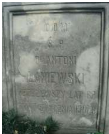
Nagrobek 14 – Rok 2013, 16 sierpnia. Nagrobek Antoniego Łaniewskiego

Zmarł, w wieku 67 lat, 17 stycznia 1907 roku. Pochowany na cmentarzu w Hrubieszowie. W tym samym grobowcu pochowani są także: Kamila z Grabowieckich Łaniewska (zm. 22.11.1887 w wieku 39 lat), Józef Grabowiecki (zm. 30.04.1886 w wieku 75 lat).