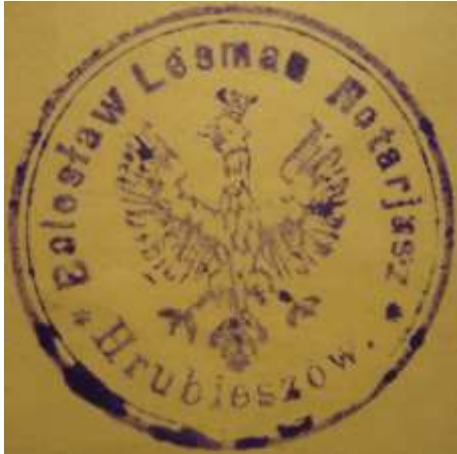
Pieczęć 2 – Rok 1919, 30 maja. Odcisk pieczęci urzędowej notariusza Bolesława Lesmiana.