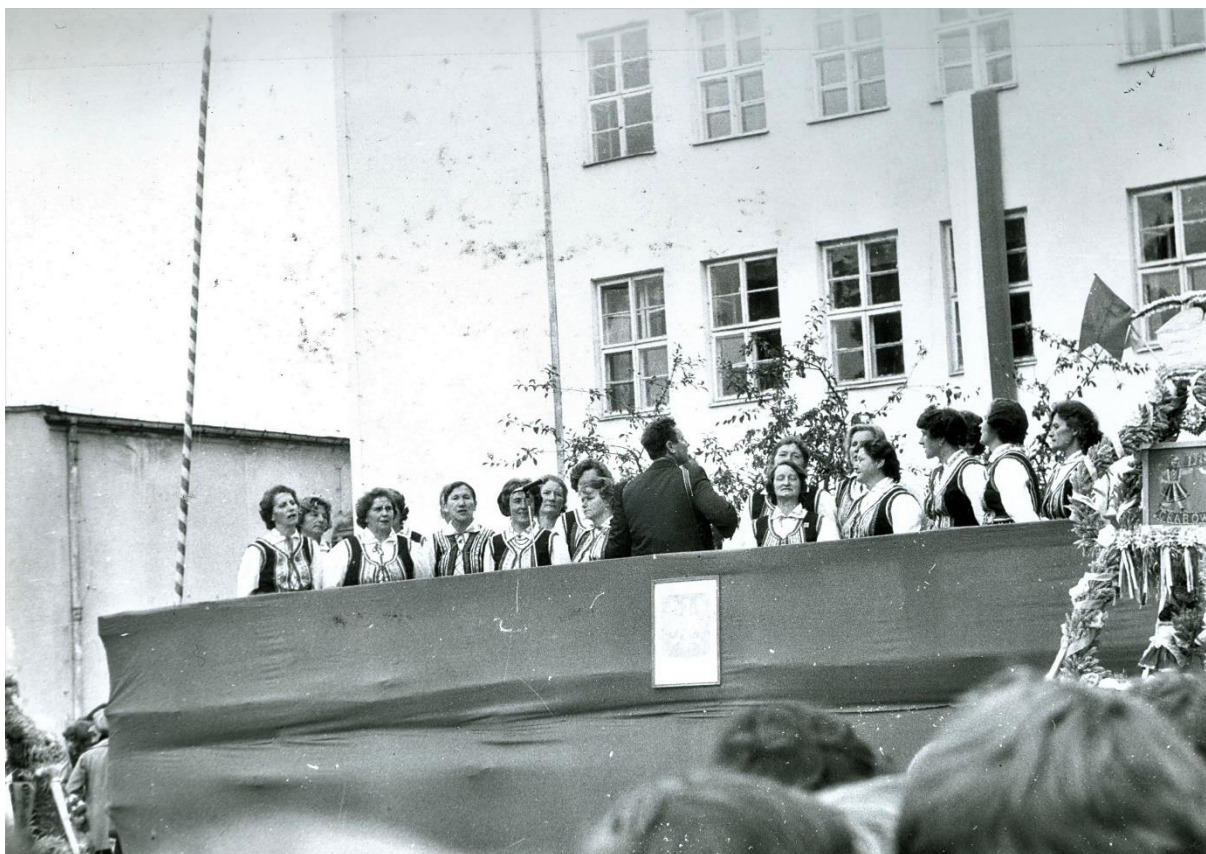
Zdjęcie 38 – Rok 1977, 18 września. Grabowiec. Gminne dożynki na placu szkolnym. Występ Żeńskiego Chóru Grabowca. Foto Tadeusz Halicki. Zdjęcie z kroniki gminy Grabowiec.