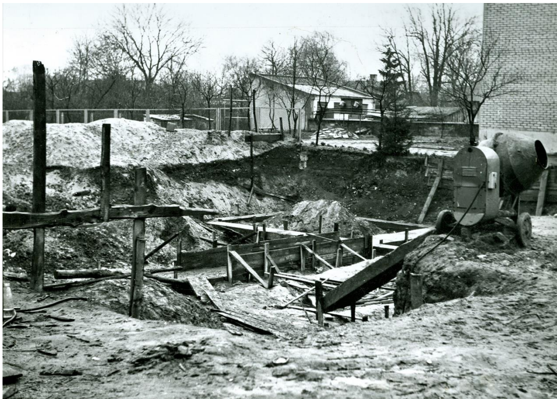
Zdjęcie 41 – Rok 1977, jesień. Grabowiec. Plac budowy siedziby urzędu gminy, przy ulicy Rynek. Z prawej widoczny jest budynek banku a w głębi garaż Czesława Kulika.