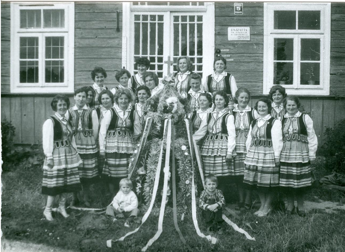
Zdjęcie 26 – Rok 1977, 15 sierpnia. Grabowiec. Parafialne dożynki. Żeński Chór Grabowca.