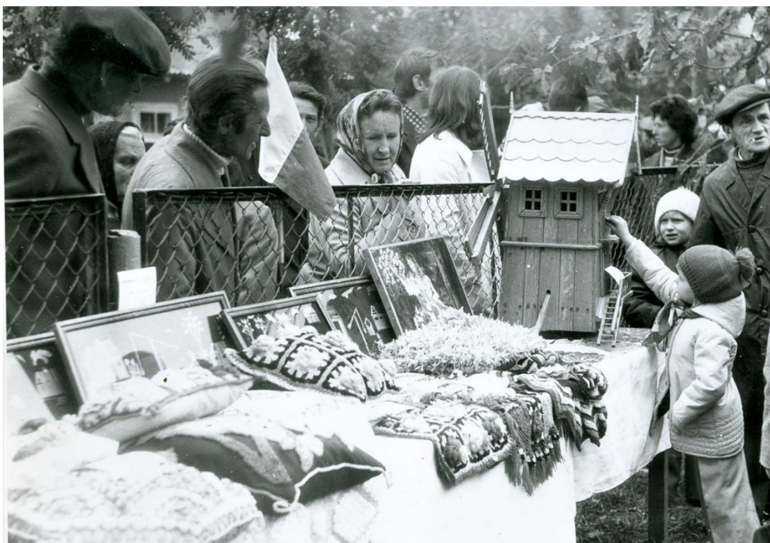
Zdjęcie 39 – Rok 1977, 18 września. Grabowiec. Gminne dożynki na placu szkolnym. Wystawa prac twórców ludowych. Foto Tadeusz Halicki. Zdjęcie z kroniki gminy Grabowiec.