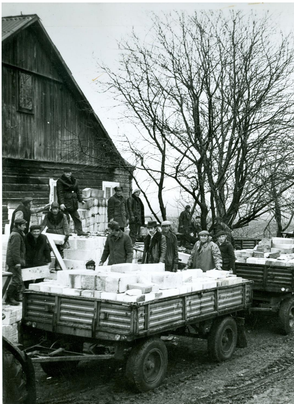
Zdjęcie 40 – Rok 1977, jesień. Grabowiec. Czyn społeczny strażaków. Transport materiałów budowlanych zgromadzonych przy siedzibie urzędu gminy, przy ulicy Wojsławskiej na plac budowy nowej siedziby przy ulicy Rynek. Foto Tadeusz Halicki. Zdjęcie z kroniki gminy Grabowiec.