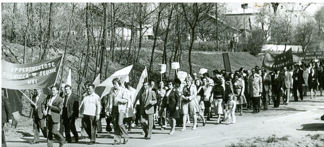
Zdjęcie 8 – Rok 1977, 1 maja. Grabowiec, ul. Wojsławska. Pochód 1 majowy. Foto Tadeusz Halicki. Zdjęcie z kroniki gminy Grabowiec.