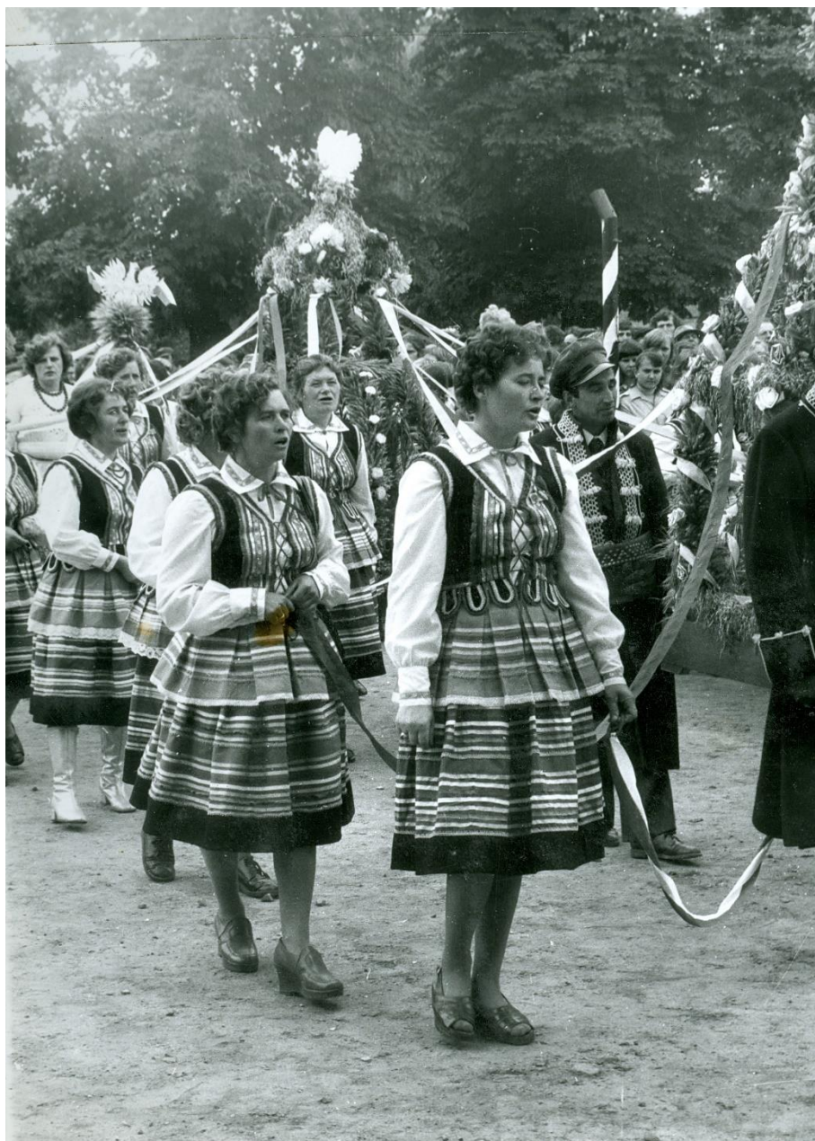
Zdjęcie 35 – Rok 1977, 18 września. Grabowiec. Gminne dożynki na placu szkolnym. Członkinie Żeńskiego Chóru Grabowca prowadzą wieniec dożynkowy.