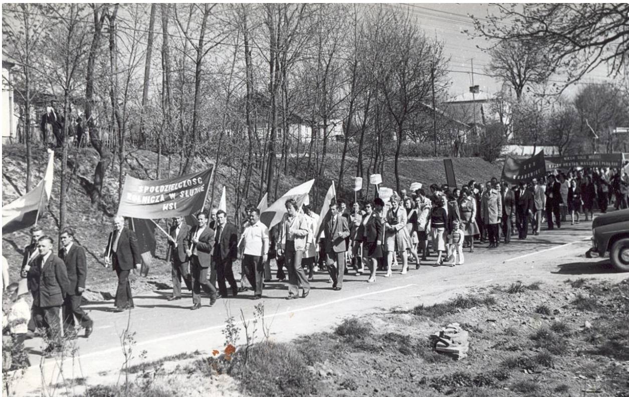
Zdjęcie 7 – Rok 1977, 1 maja. Grabowiec, ul. Wojsławska. Pochód 1 majowy.