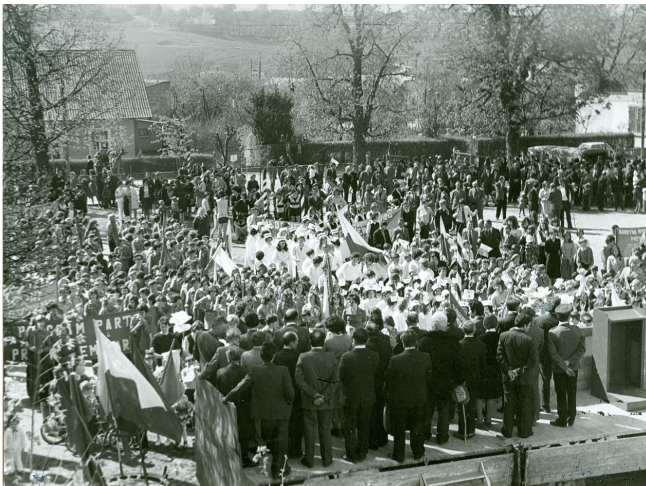
Zdjęcie 11 – Rok 1977, 1 maja. Grabowiec, plac szkolny. Przemówienia z okazji Święta Pracy. Foto Tadeusz Halicki. Zdjęcie z kroniki gminy Grabowiec.