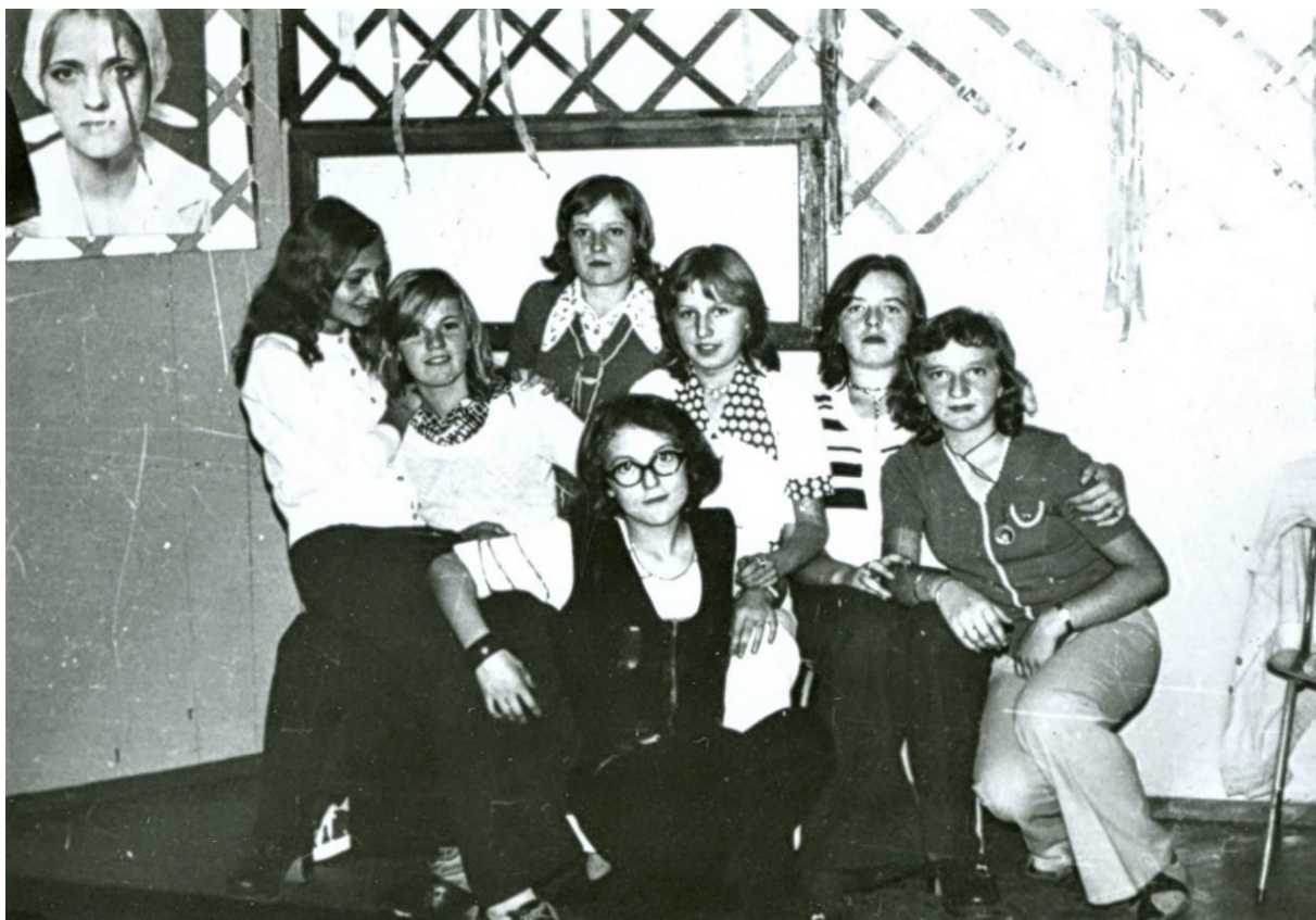
Zdjęcie 1 – Rok szkolny 1976/77. Grabowiec. Uczennice klasy VIII b.