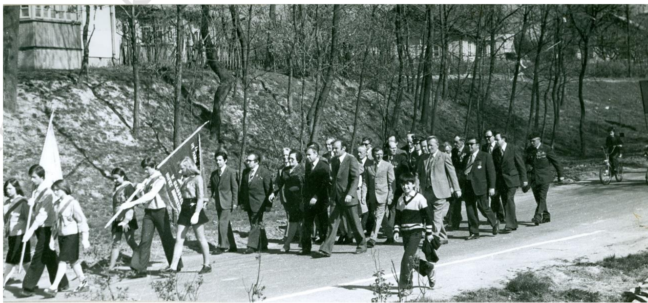
Zdjęcie 6 – Rok 1977, 1 maja. Grabowiec, ul. Wojsławska. Pochód 1 majowy. Foto Tadeusz Halicki. Zdjęcie z kroniki gminy Grabowiec.