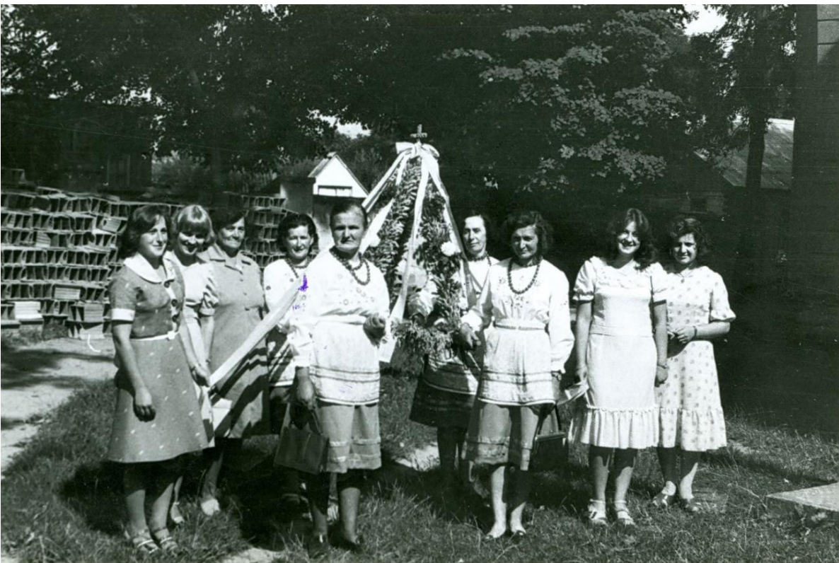
Zdjęcie 27 – Rok 1977, 15 sierpnia. Grabowiec. Parafialne dożynki. Parafianki z Bereścia z wieńcem dożynkowym.