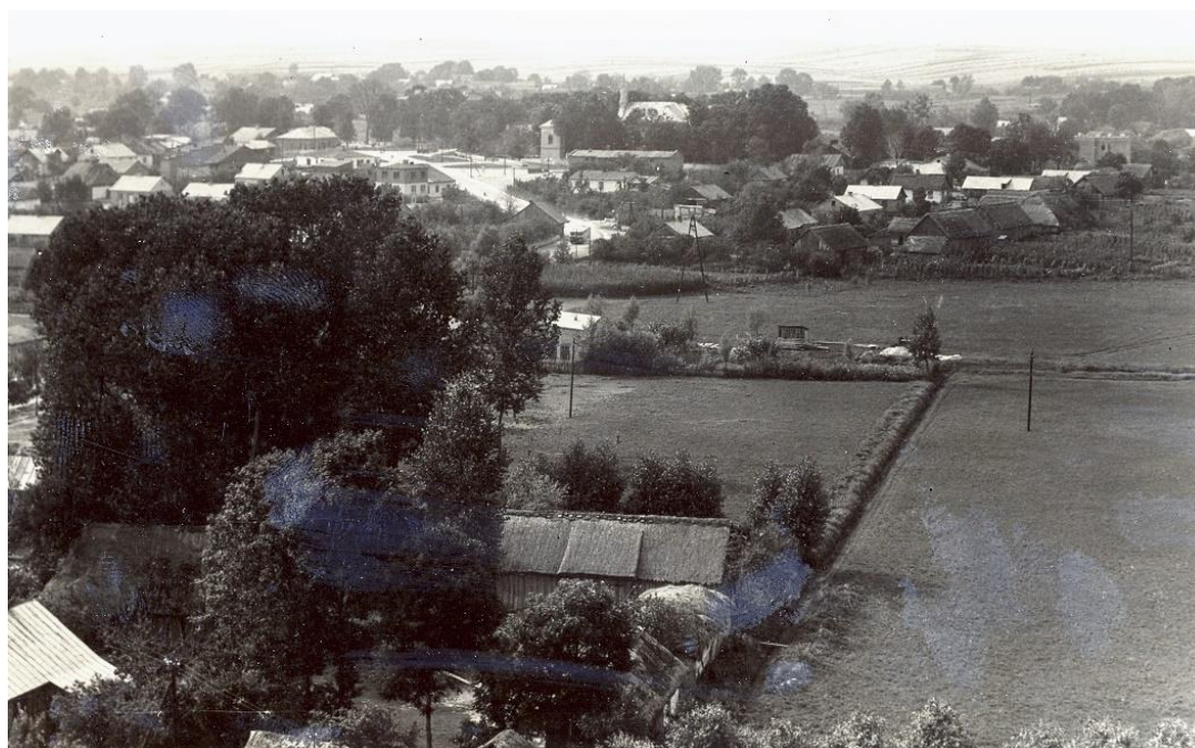
Zdjęcie 2 – Rok 1964. Panorama Grabowca. Na zdjęciu widoczny jest kościół św. Mikołaja wraz z dzwonnica, przed nim długi budynek – magazyn GS. Po lewej stronie widać dom rodziny Kulik, po jego prawej stronie za drzewami jest budynek szkoły. Po prawej stronie w głębi widać budynek ośrodka zdrowia.