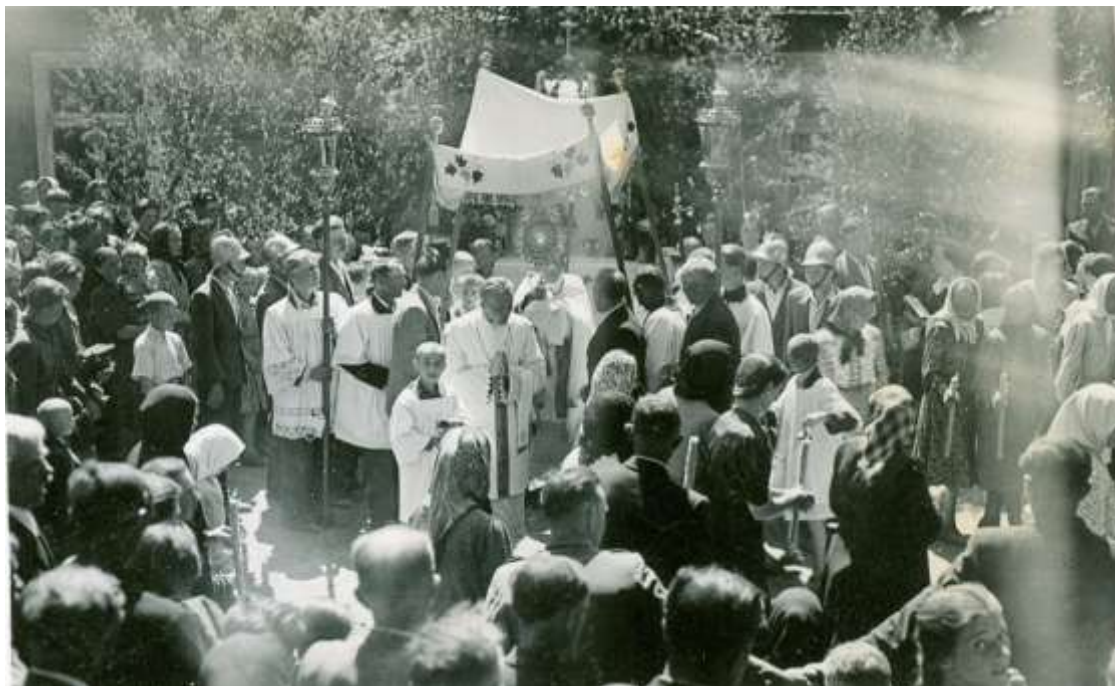
Zdjęcie 11 – Rok 1950, 8 maja. Boże Ciało. Ołtarz przy budynku poczty.