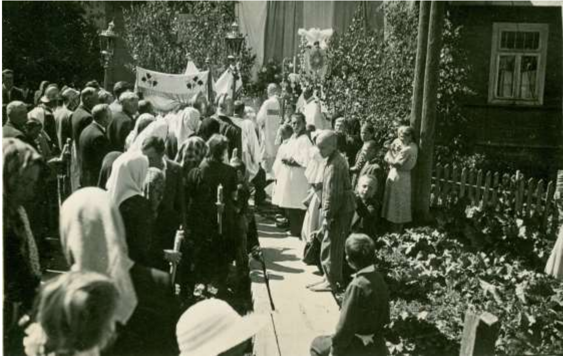
Zdjęcie 9 – Rok 1950, 8 maja. Boże Ciało (zdjęcie ze zbiorów parafii).