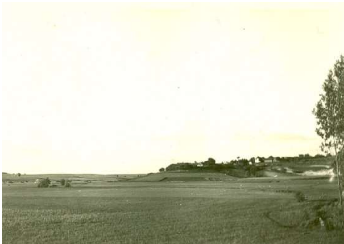
Zdjęcie 31 – Rok 1950, 18 października. Widok na Bronisławkę od strony mostu na trasie hrubieszowskiej. Po prawej stronie wyraźnie widać rzekę (zarys w trawie) obok posesji Wawrzyniuka (autor Gustaw Kulik, zdjęcie ze zbiorów Wiesława Kulika).