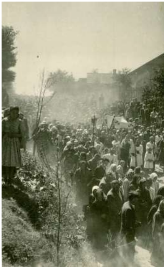
Zdjęcie 10 – Rok 1950, 8 maja. Boże Ciało. Procesja na ulicy Poprzecznej (współcześnie 700-lecia).