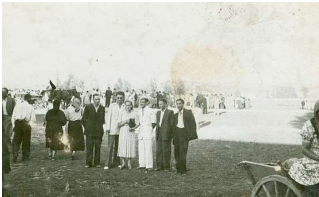
Zdjęcie 25 – Rok 1950 (około, przed 1954 rokiem). Festyn.