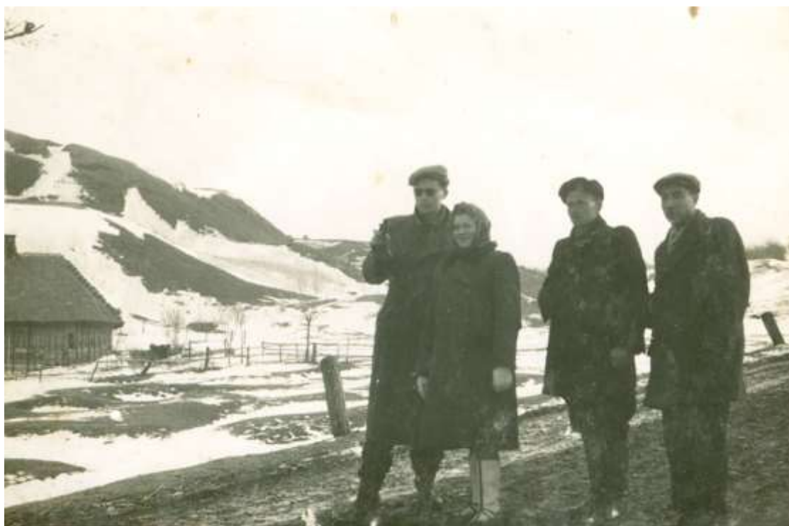
Zdjęcie 29 – Rok 1950 (około, przed 1954 rokiem). Na drodze Grabowiec—Grabowiec-Góra, w tle „Góra Zamkowa”.