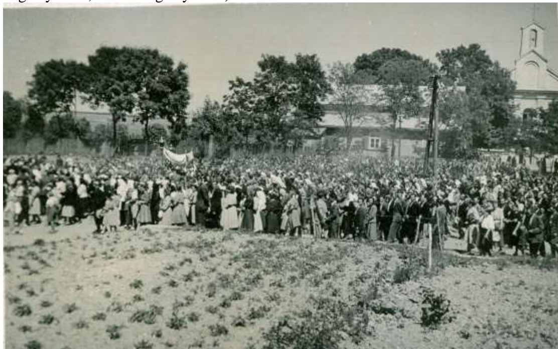
Zdjęcie 8 – Rok 1950, 8 maja. Boże Ciało.