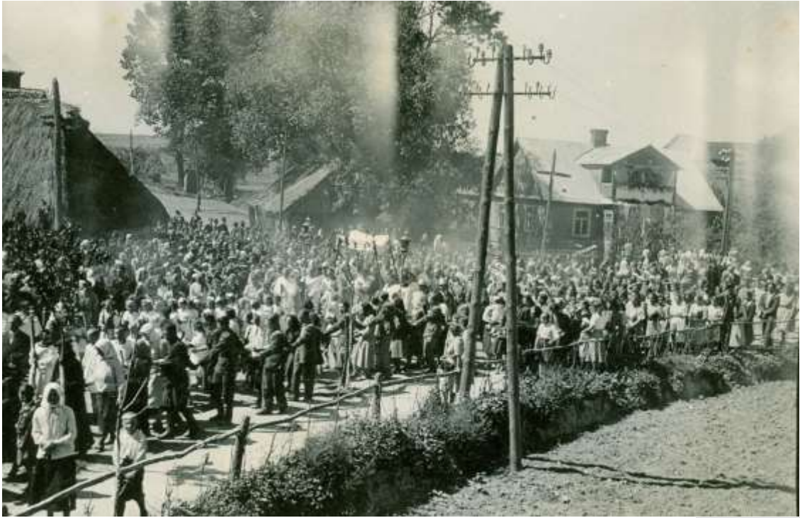
Zdjęcie 13 – Rok 1950, 8 maja. Boże Ciało. Procesja na ulicy Wojsławskiej.