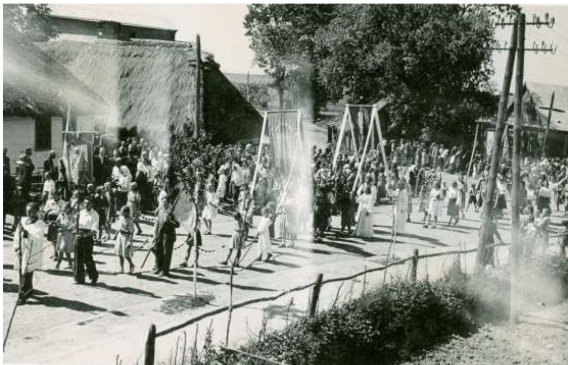
Zdjęcie 12 – Rok 1950, 8 maja. Boże Ciało. Procesja na ulicy Wojsławskiej.