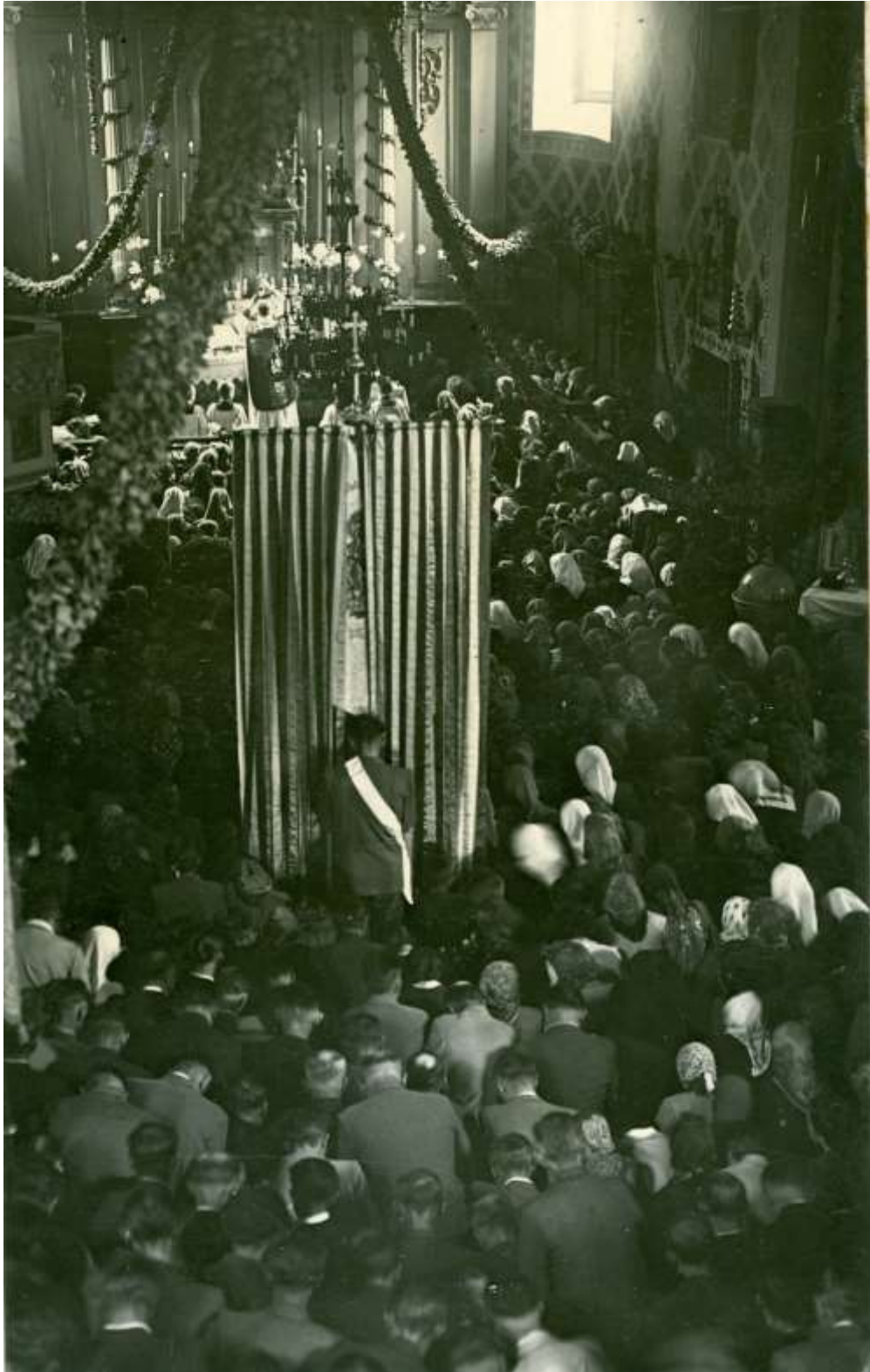
Zdjęcie 18 – Rok 1950, 28 czerwca. Poświęcenie chorągwi – wotum z okazji 6-tej rocznicy pacyfikacji parafii Grabowiec (zdjęcie z kroniki parafialnej).