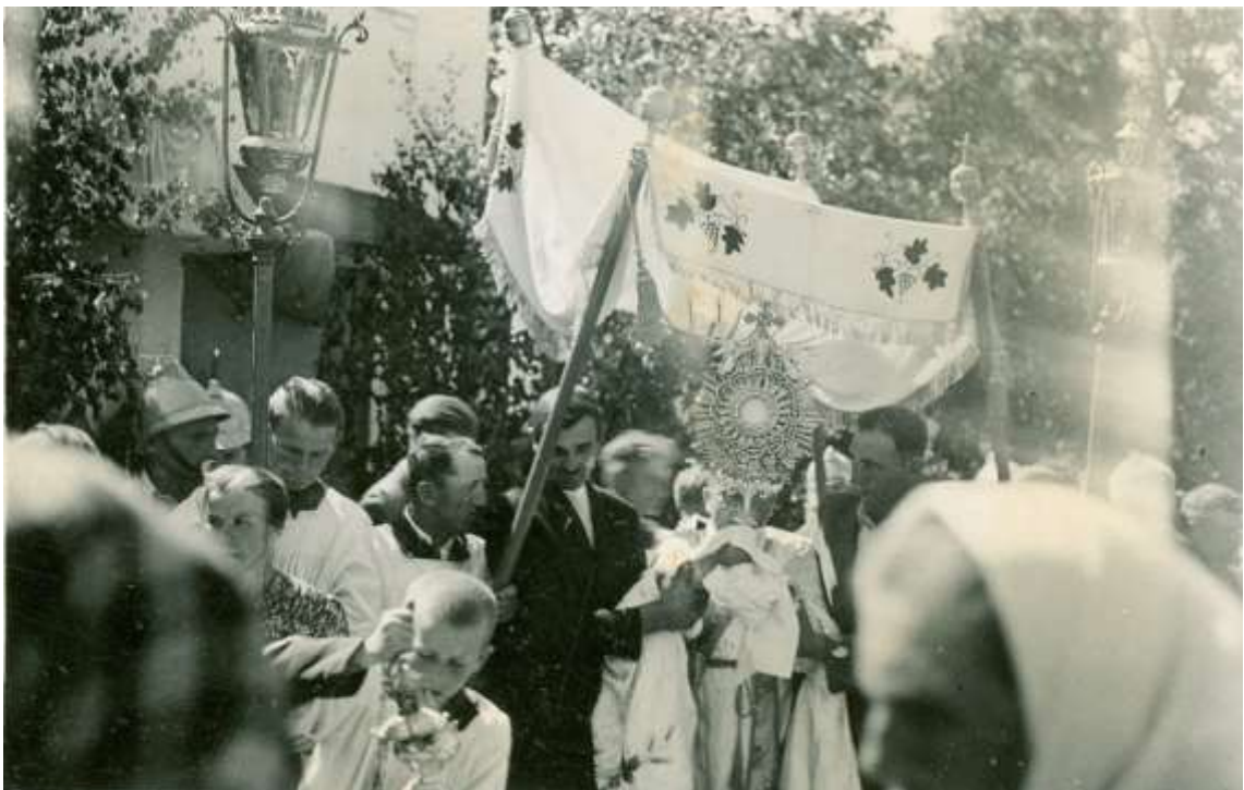
Zdjęcie 14 – Rok 1950, 8 maja. Boże Ciało. Ołtarz przy sklepie Dwojakowskiego.