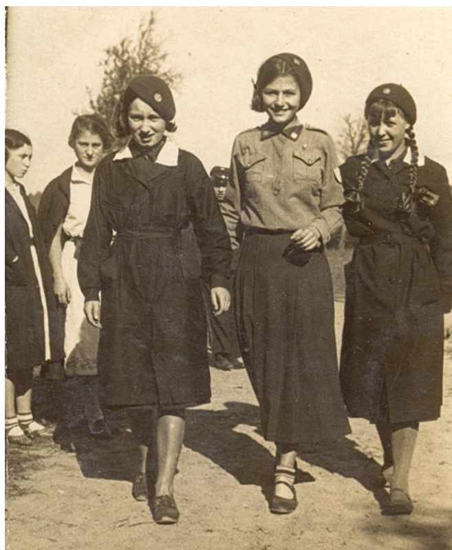
Zdjęcie 4 – Rok 1935, 11 października. Uczennice szkoły handlowej w Chełmie. W pierwszym rzędzie od lewej stoją: n, Mościbrodzka, Kazia Kobylańska.