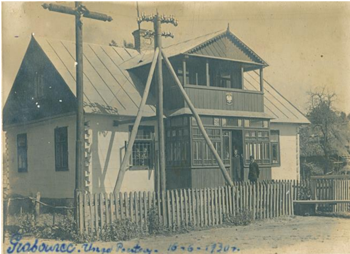
Zdjęcie 5 – Rok 1930, 16 czerwca. Siedziba Urzędu Poczty i Telegrafu w Grabowcu. Budynek powstał, co najmniej, w 1927 roku (na kominie widnieje rok: 1927).