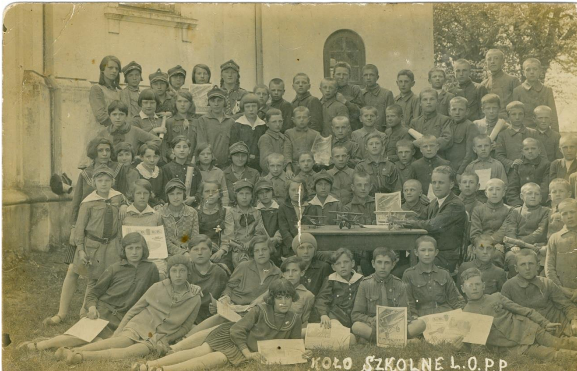
Zdjęcie 8 – Opis jak wyżej (zdjęcie ze zbiorów Ryszarda Karczmarczuka).