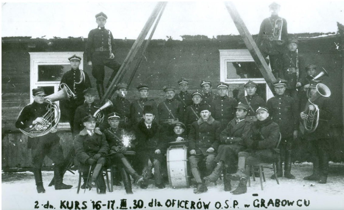
Zdjęcie 1 – Rok 1930, 17 marca. Uczestnicy kursu dla oficerów OSP w Grabowcu.