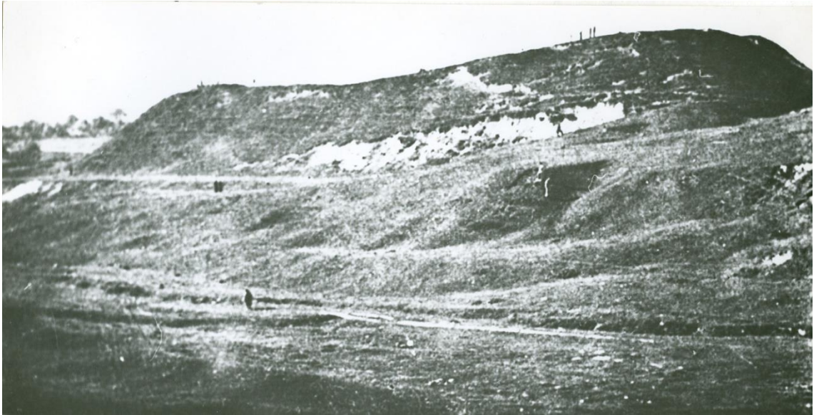
Zdjęcie 10 – Lata 30-te XX wieku. Widok na „Górę Zamkową” od strony drogi Grabowiec- Grabowiec-Góra.