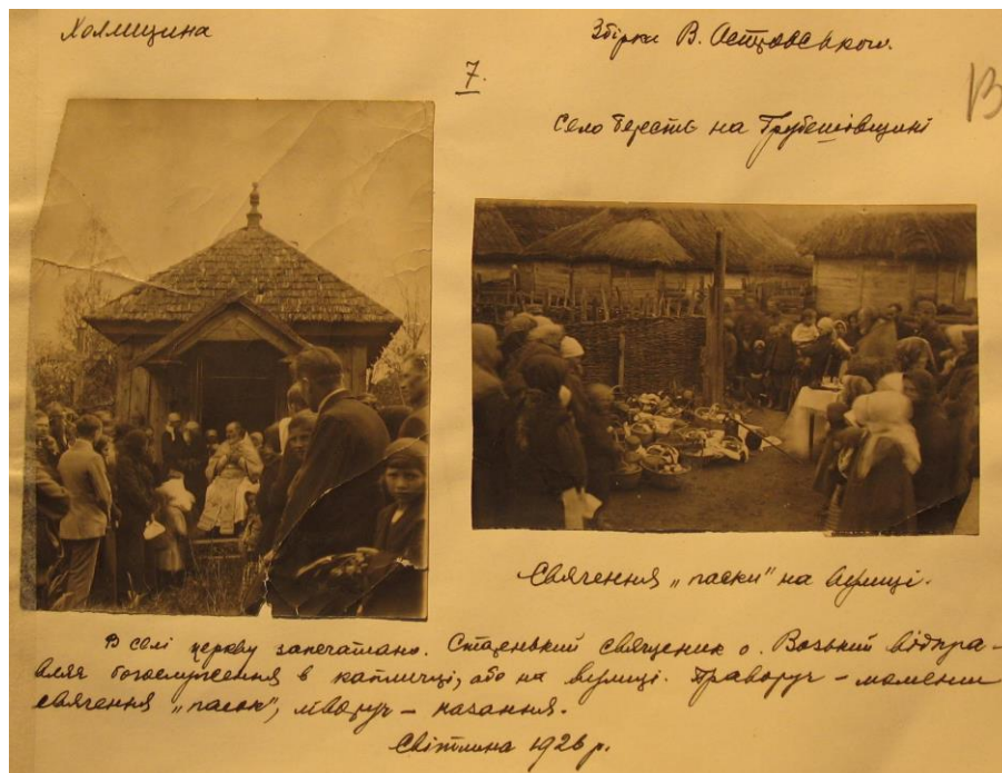
Zdjęcie 16 – Rok 1926. Chełmskie. Fotokopia. Wieś Bereść, hrubieszowskie. Z tłumaczenia: Na wsi cerkiew była zamknięta. Pop w podeszłym wieku o. Wazkij udziela błogosławieństwa w kapliczce lub na ulicy. Za zdjęciem z prawej strony – moment poświęcenia wielkanocnych koszyczków. Z lewej strony msza święta.