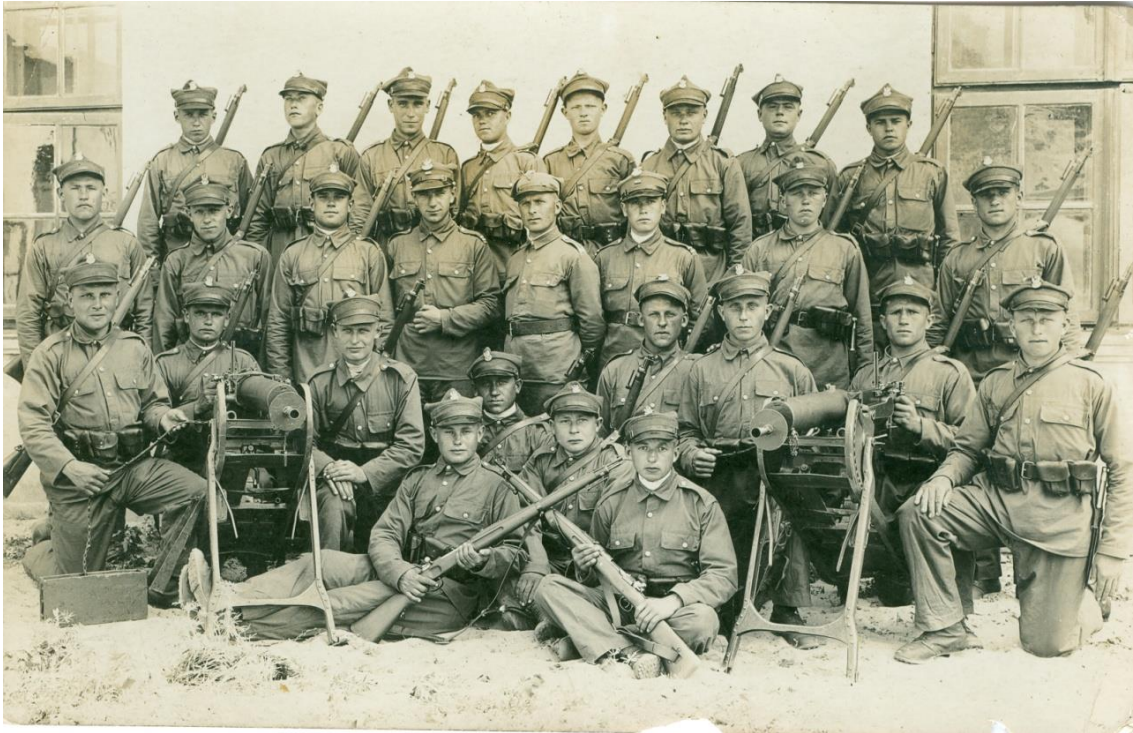
Zdjęcie 14 – Rok 1924 (około). Pluton żołnierzy zapewne 34. Pułku Piechoty. Pluton jest wyposażony w dwa karabiny maszynowe CKM MAXIM 08. Zdjęcie ze zbiorów Mariana Sawińca, przekazane przez Marka Gąskę; opis zdjęcia Ryszard Karczmarszuk.