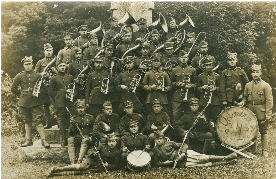
Zdjęcie 8 – Rok 1922, 13 lipca (prawdopodobnie). Orkiestra 34. Pułku Piechoty. Zdjęcie wykonane na tle pomnika (poza Grabowcem; prawdopodobnie w Białej Podlaskiej).