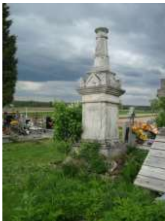
Nagrobek 1 – Rok 2016, 7 maja. Grób rodziny Chróściewiczów w Księżpolu.