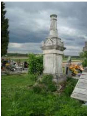
Nagrobek 1 – Rok 2016, 7 maja. Grób rodziny Chróściewiczów w Księżpolu.