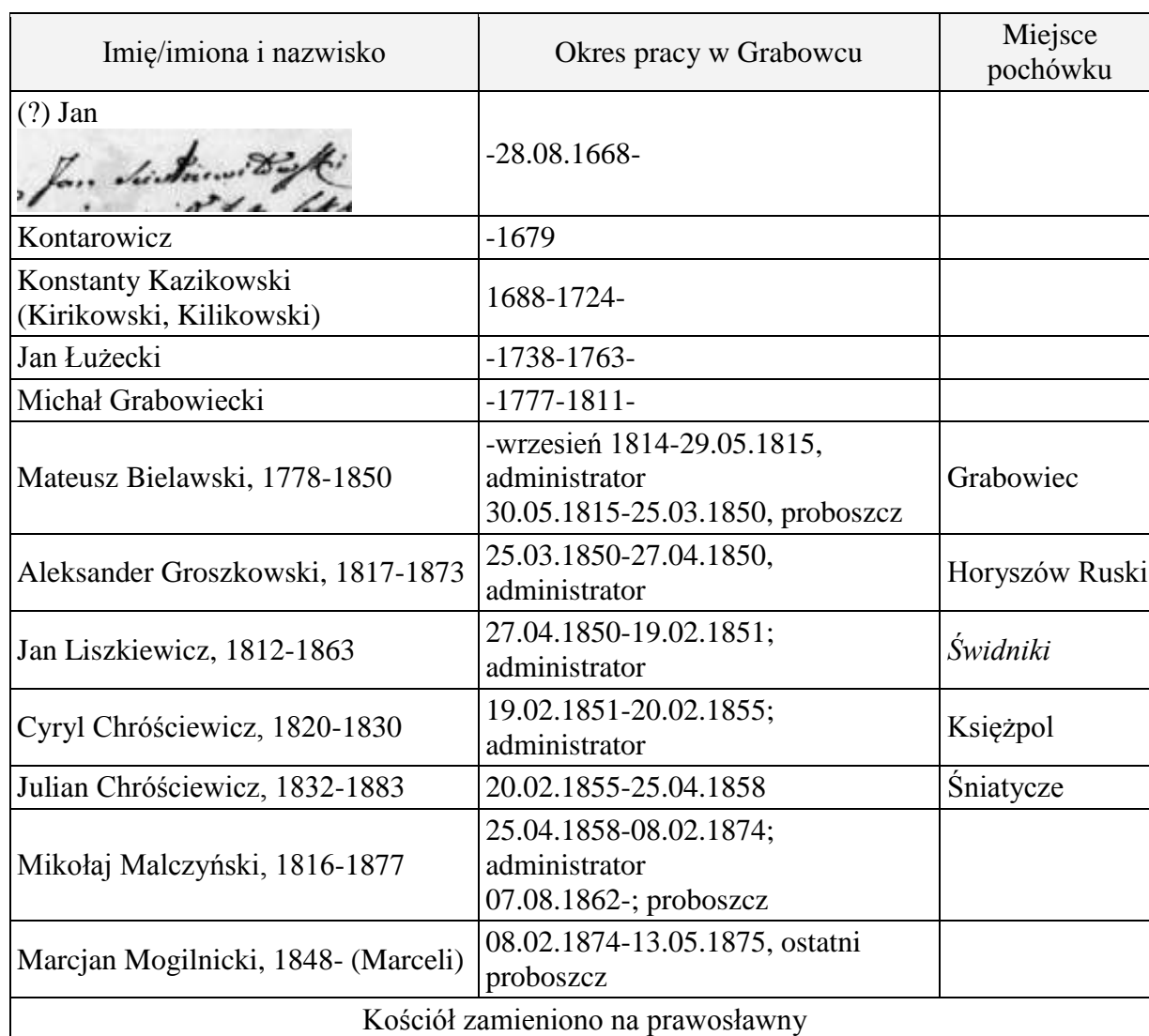
Tabela 5 – Chronologiczny wykaz księży parafii unickiej w Grabowcu