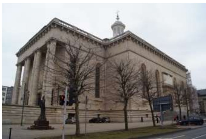
Zdjęcie 6 – Rok 2018, 1 kwietnia. Archikatedra Chrystusa Króla w Katowicach.