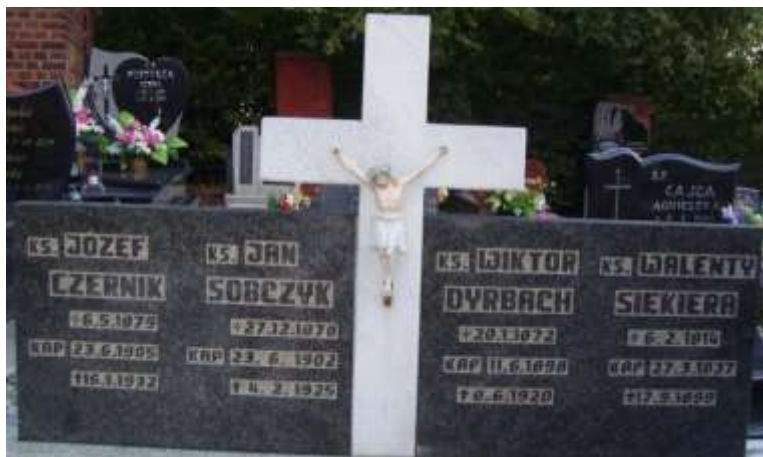
Nagrobek 8 – Rok 2017, 1 października. Nagrobek księży na cmentarzu, przy kościele św. Katarzyny w Jastrzębiu-Zdroju.

Zmarł 17 września 1890 roku. Pochowany, w grobowcu księży, na cmentarzu parafii św. Katarzyny w Jastrzębiu-Zdroju.