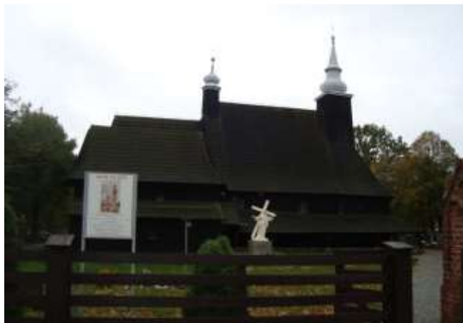
Zdjęcie 8 – Rok 2017, 8 października. Kościół św. Anny, z 1518 roku, filialny parafii Bożego Ciała w Oleśnie.