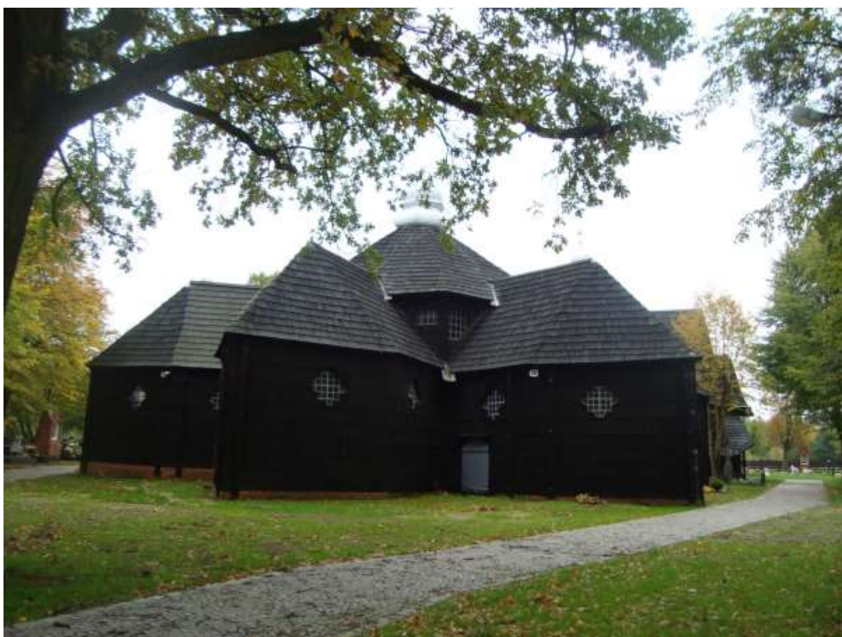
Zdjęcie 9 – Rok 2017, 8 października. Kościół św. Anny, z 1518 roku, filialny parafii Bożego Ciała w Oleśnie.