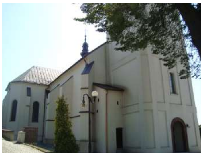
Zdjęcie 21 – Rok 2017, 1 sierpnia. Kościół św. Trójcy w Będzinie.