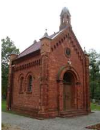
Zdjęcie 10 – Rok 2017, 8 października. Kaplica na cmentarzu przykościelnym św. Anny w Oleśnie.