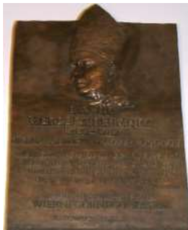
Zdjęcie 2 – Rok 2018, 1 kwietnia. Epitafium biskupa Herberta Bednorza w archikatedrze w Katowicach.