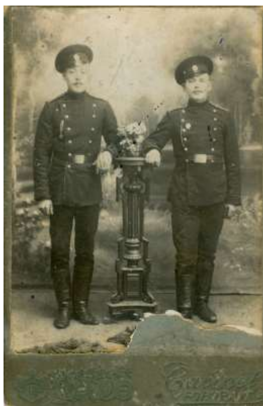
Zdjęcie 6 – Rok 1915 (około). Polacy (z Grabowca) w armii carskiej.