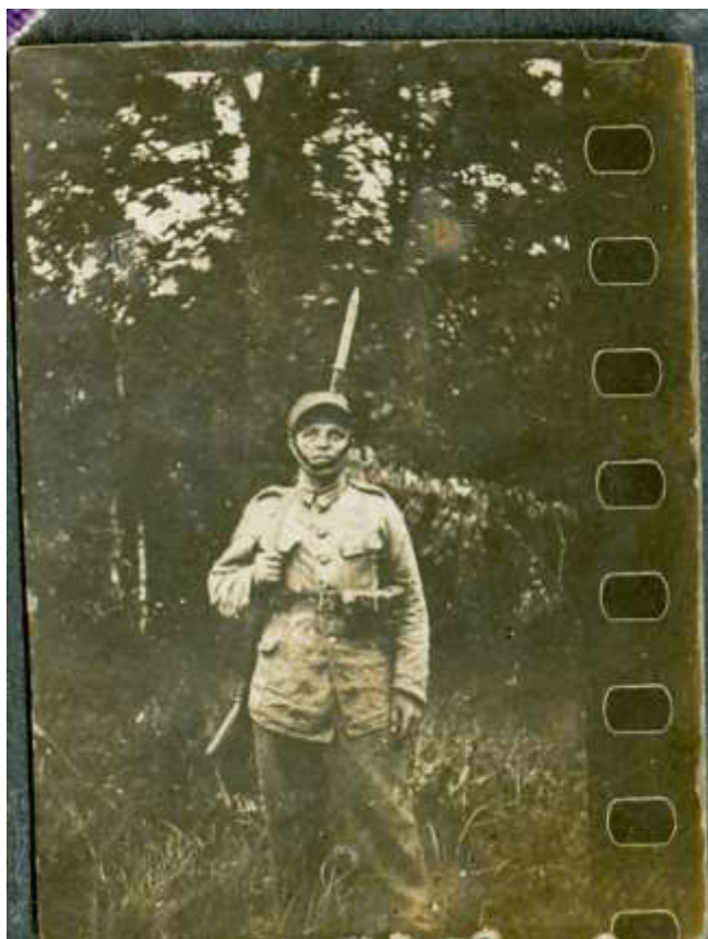
Zdjęcie 1 – Rok?