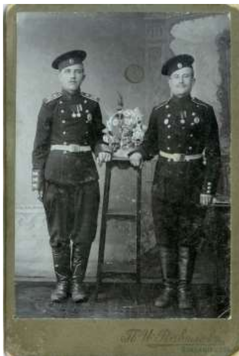
Zdjęcie 7 – Rok 1915 (około). Polacy (z Grabowca) w armii carskiej.