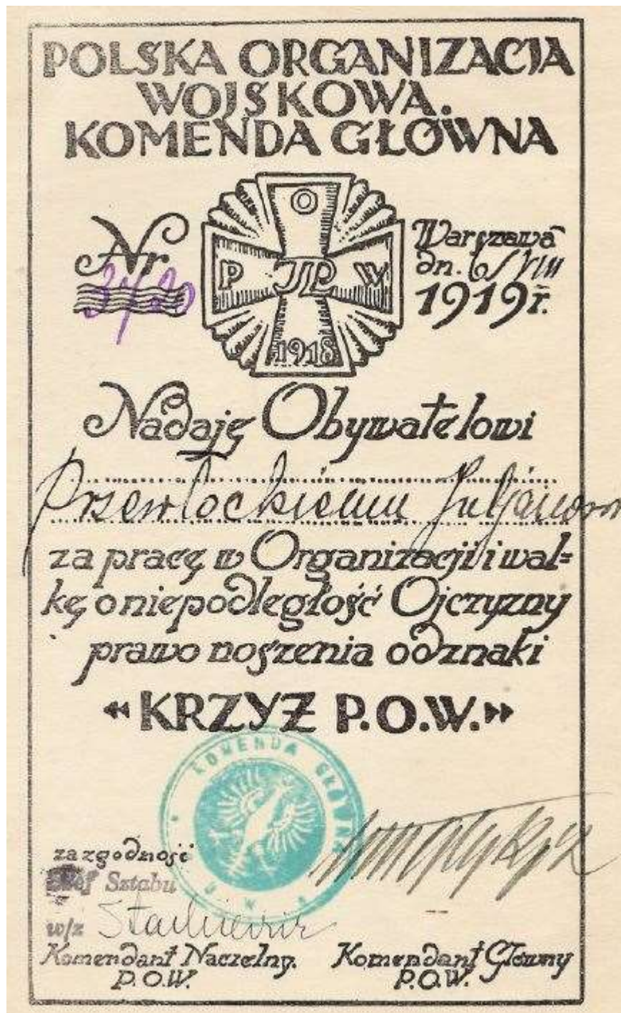
Dokument 4 – Rok 1919, 6 sierpnia. Dyplom nadania odznaki „Krzyż P.O.W.” za pracę w Polskiej Organizacji Wojskowej i za walkę o niepodległość ojczyzny.